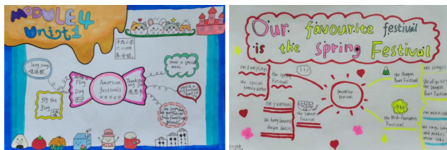
图 3 学生的思维导图作品

以外研版新标准六年级上册 Module 4 为例,分析学生绘制的思维导图,如图 3 所示。