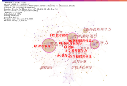
图 3 关键词共现图谱